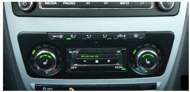
Obr. 2 příklad panelu Climatronic po faceliftu