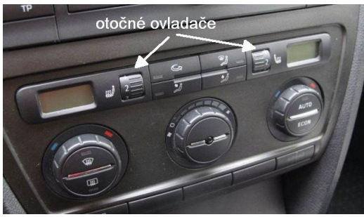
Obr.1 příklad panelu Climatronic před faceliftem